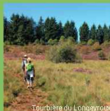
Tourbière du Longeyroux